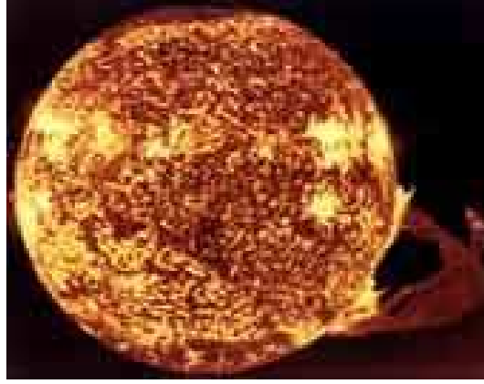
Figure 3: Una foto della fornace nucleare all'interno del Sole per illustrare: l'impossibilità per la relatività ristretta di essere esattamente valida nel suo interno; la isorelatività santilliana costruita proprio per problemi interni; e la concezione santilliana della gravitazione come dovuta all'energia di un corpo celeste e non alla massa, come assunto sin dai tempi di Newton, assunzione necessaria per raggiungere l'universalità della gravitazione dal momento che la luce non ha massa, ed è quindi fuori dalla gravitazione newtoniana, ma ha energia ed è quindi parte della gravitazione santilliana.

risultati basati sui numeri reali convenzionali vanno rivisti con attenzione, come fatto dal matematico cinese C.-X. Jiang [5]. Come ulteriore indicazione della nontrivialità dei numeri isotopici santilliani, basta indicare che il famoso teorema di Fermat, la cui prova è stata complessissima, sembra essere dimostrabile proprio come lo fece Fermat, ossia sul bordo del quaderno. Similmente, sembra che la congettura di Riemann, la cui prova è stata impossibile fino ad oggi, sia sbagliata con conseguenze enormi per tutta la matematica.